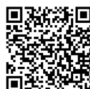
第二階段 報名 QR Code