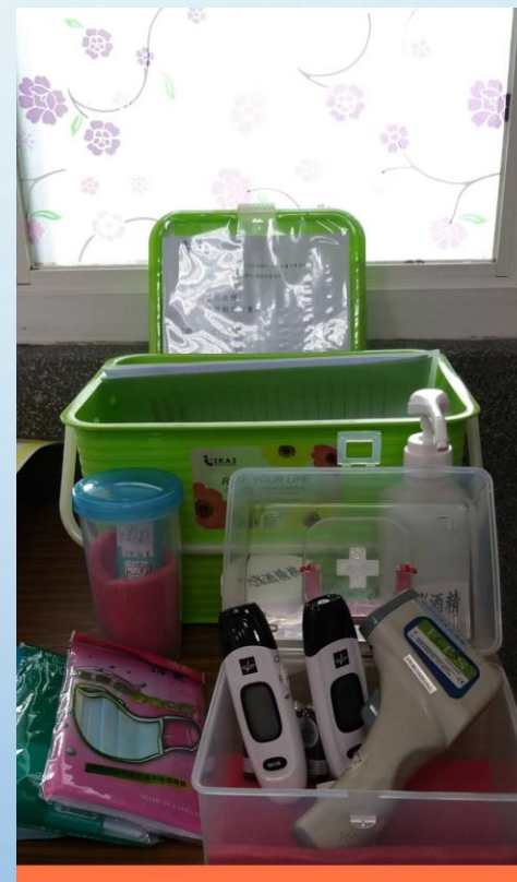
每一門口體溫量測站:額溫 槍3支、耳溫槍1支、75% 酒精、清潔棉球、成人兒 童口罩