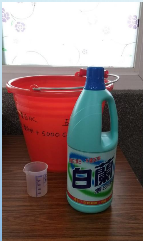
班級環境消毒備有： 水桶、量杯、漂白水