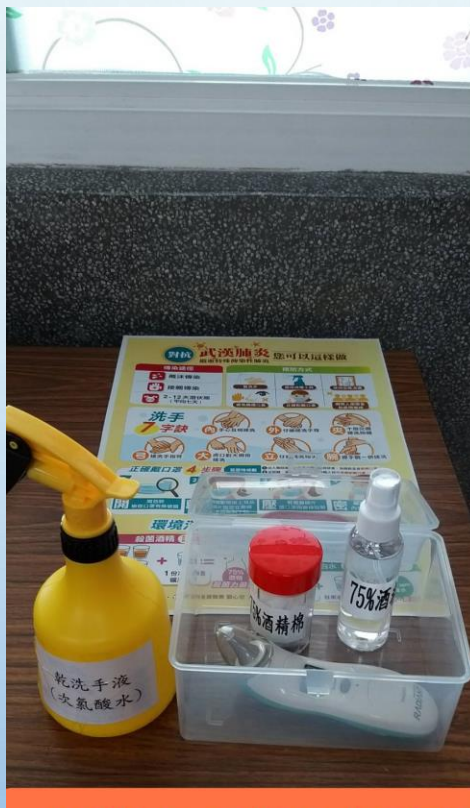
班級物資:耳溫槍或額溫槍 1支、清潔酒精棉、75%酒 精、乾洗手液、宣導海報